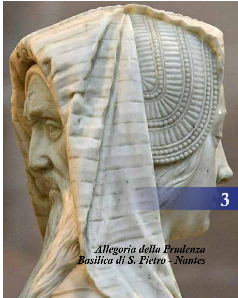
Allegoria della Prudenza Basilica di S. Pietro - Nantes

un Giano bifronte o con lo specchio a due facce. Comporta una decisione deliberata con lentezza, ma eseguita prontamente, con decisione, perché il tentennare, nella prudenza, è... da imprudenti! La prudenza è la sapienza delle cose umane. Non è perciò sapienza in senso assoluto proprio perché è “sapienza per l'uomo”. La prudenza è la retta ragione delle azioni da compiere. Per questo è la cifra dell'uomo saggio. L'uomo saggio è, infatti, prudente per definizione, in quanto determina in concreto la giusta misura fra l'audacia e la codardia o anche soltanto la semplice sconsideratezza.